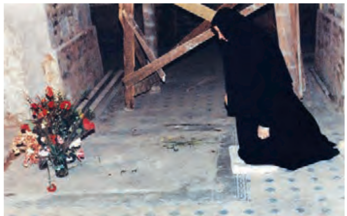
Матушка Георгия у места захоронения святого праведного Иоанна Кронштадтского в монастыре на Карповке в Санкт-Петербурге

порядок, благолепие – вот, что ей хотелось видеть в «дому Божьем». Этим она хотела послужить Богу и людям. В каждом деле, за которое бралась, твердо уповала на Бога, и Он чудесно помогал во всем.