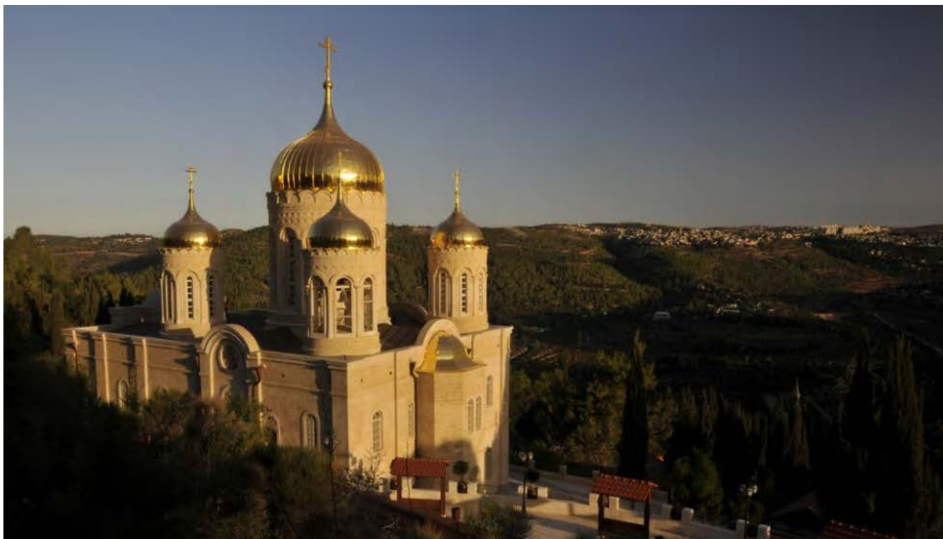
Восстановленный храм Всех святых, в земле Российской просиявших