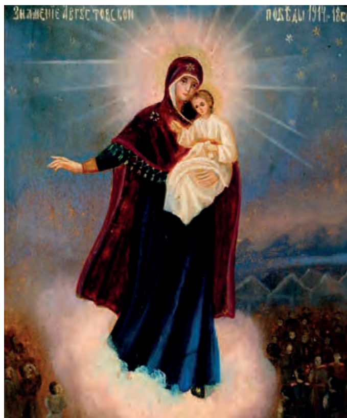
Августовская икона Божией Матери из церкви святителя Николая, хутора Клецко-Почтовского. С 1994 г. находится в Кременско-Вознесенском монастыре Волгоградской епархии

К святому образу обращаются, в первую очередь, в военную годину, чтобы испросить победу над врагом. Особо почитают Августовскую икону солдатские матери. Пока их сыновья отдают долг Родине, матери просят об их благополучном возвращении, а потом благодарят Богородицу за то, что хранила