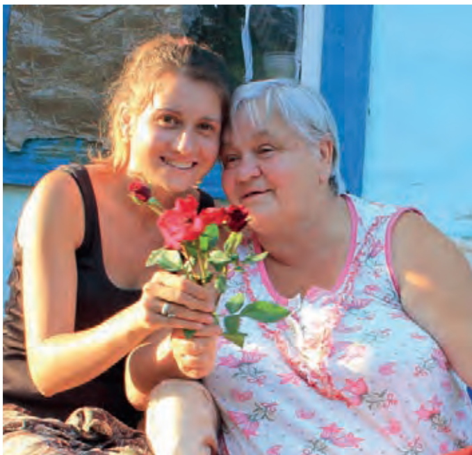
С бабушкой на Украине

нашей области на тот момент мало было храмов, и такого не было, чтобы мы с бабушкой в воскресенье ходили в храм. А в Москве, когда она приезжала, мы ходили к Матронушке в Покровский монастырь, где она трудничала.