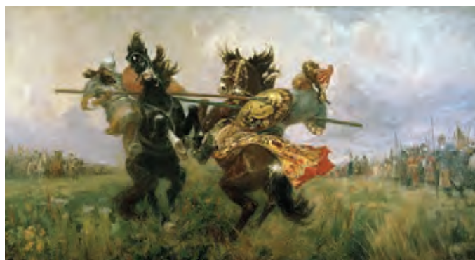
Поединок Пересвета с Челубеем на Куликовом поле. Художник Михаил Иванович Авиллов

Наиболее правильную оценку войны как подвига или, напротив, разбоя можно сделать, лишь исходя из анализа нравственного состояния воюющих. «Не радуйся смерти человека, хотя бы он был самый враждебный тебе: помни, что все мы умрем» , — говорит