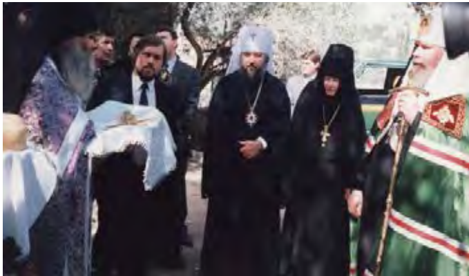
Святейший Патриарх Алексий II, будущий Святейший Патриарх Кирилл, матушка Георгия

Стать игуменьей лежащего в руинах монастыря вдали от Родины на чужой земле, где всё не так, как ты привык, среди иного языка, других вероисповеданий и культуры, среди совершенно непривычных сложностей бытовой жизни и отсутствия самых необходимых удобств вроде воды – это, и правда, крест огромного смирения и послушания. Но, кажется, сами святые холмы земного отечества нашего Спасителя благодатно помогали. Тот, кто побывал в Горнем монастыре за последние 15 лет и видел, как он преобразился, читая эти воспоминания матушки, понимает, какую колоссальную работу проделала хрупкая и смиренная русская монахиня и что все это без веры в благодатную помощь Божью было бы просто невозможно.