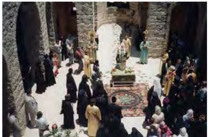
Начало возрождения Горненской обители

Пророчества об «игуменском кресте в Иерусалиме» звучали в жизни матушки не раз и задолго до 1991 года, будто заранее готовя ее к этому последнему и, может быть, самому тяжелому послушанию в ее жизни.