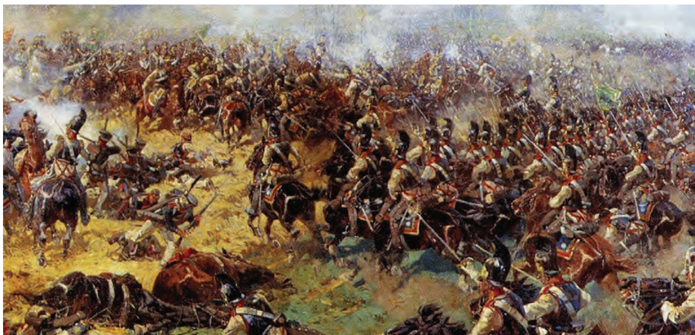
Фрагмент панорамы Бородинская битва. Франц Алексеевич Рубо

Мир в Новом Завете, как и в Ветхом, рассматривается как дар Божией любви. Вневременность мира, возвещенного пророками, особенно явно видна в Евангелии от Иоанна. В истории продолжает царствовать скорбь, но во Христе верующие имеют мир (Ин. 14. 27; 16. 33). Мир в Новом Завете есть нормальное благодатное состояние человеческой души, освобожденной от рабства греху. Именно об этом говорят пожелания